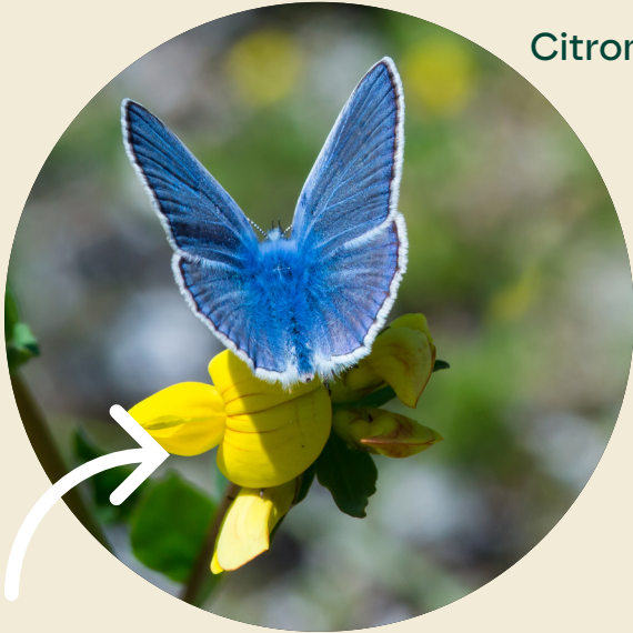
Alm. blåfugl på kællingetand