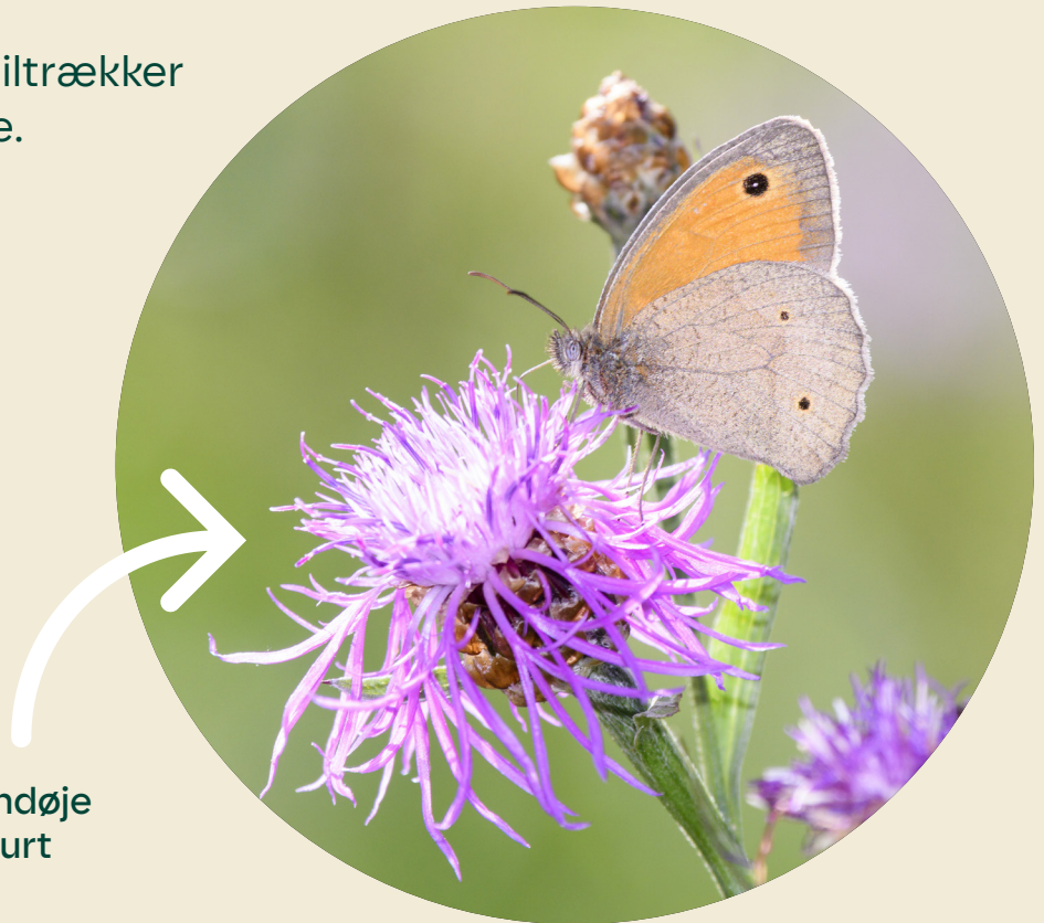
Græsrandøje på knopurt

Plant blomster, der tiltrækker havens sommerfugle.