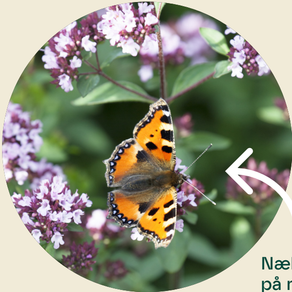
Nældens takvinge på merian